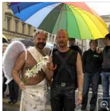
München tolerant und offen: Schwule beim Christopher Street Day.